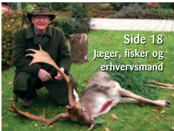
Side 18 Jæger, fisker og erhvervsmand