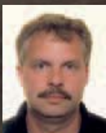
Tekst og foto Mikkel Sørensen

Efter godt 32 timers flyvning og venten begynder det at lysne. Jeg er landet i Anchorage, Alaska kl. 08.40 den 29. september 2009. Der er endnu fem timer til, jeg efter planen skal lande i Gold Bay på Alaska Peninsula, endestationen for min rejse.