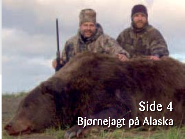
Side 4 Bjørnejagt på Alaska