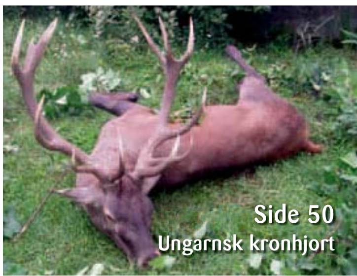
Side 50 Ungarnsk kronhjort

Nu kan du følge NSK på Facebook www.facebook.dk/Nordisksafariklub.dk