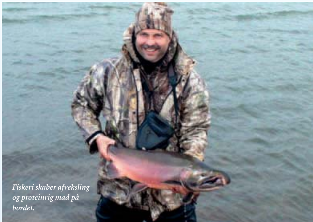
Fiskeri skaber afveksling og proteinrig mad på bordet.

Hjemmefra har jeg bestemt, at kan jeg skyde en bjørn over ni fod, vil det være godt – er den større vil det være en ekstra bonus. Jeg siger til Spencer, at vi prøver. Er det en stor skudbar bjørn, så må jeg tage den, selvom det er første dag. Solen skinner fra en skyfri himmel, da vi bevæger os ned fra vores udsigtspost, som er cirka 30 meter over jorden. Skråningen er ret stejl på denne side. Vel nede finder vi en bjørneveksel, som vi kan følge – det er lidt nemmere, når der er trampet for. Det er nærmest, som at gå i en våd dansk eng eller marsk. Jeg har mine neopren skridtstøvler på, et absolut must i dette terræn. Jeg har ikke nogen jakke eller rygsæk på, alligevel får jeg sved på panden, solen har fået temperaturen op. Da vi nærmer os floden, bevæger min puls