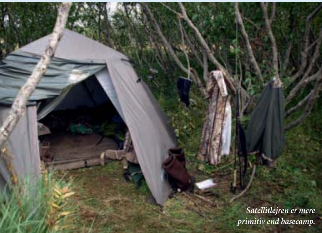
Satellitlejren er mere primitiv end basecamp.

Om eftermiddagen tager vi ud til munden af Joshua Green floden, det er den vores ø er på. Den løber ud i Moffet Lagoon, som hænger sammen med Izembek Lagoon. Her findes nogle af de største ålegræs-områder i verden. Her samles bl.a. 98 % af verdens pacific black brant, en lille søgås, for at æde ålegræs, før de flyver 4.800 km nonstop til Mexico. Her findes også masser af andre ænder og gæs, hvoraf nogle arter har vinterophold her. Ørnene ynder at sidde her ved lavvande og gøre sig til gode