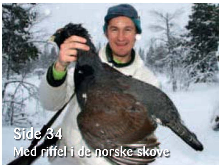
Side 34 Med riffel i de norske skove